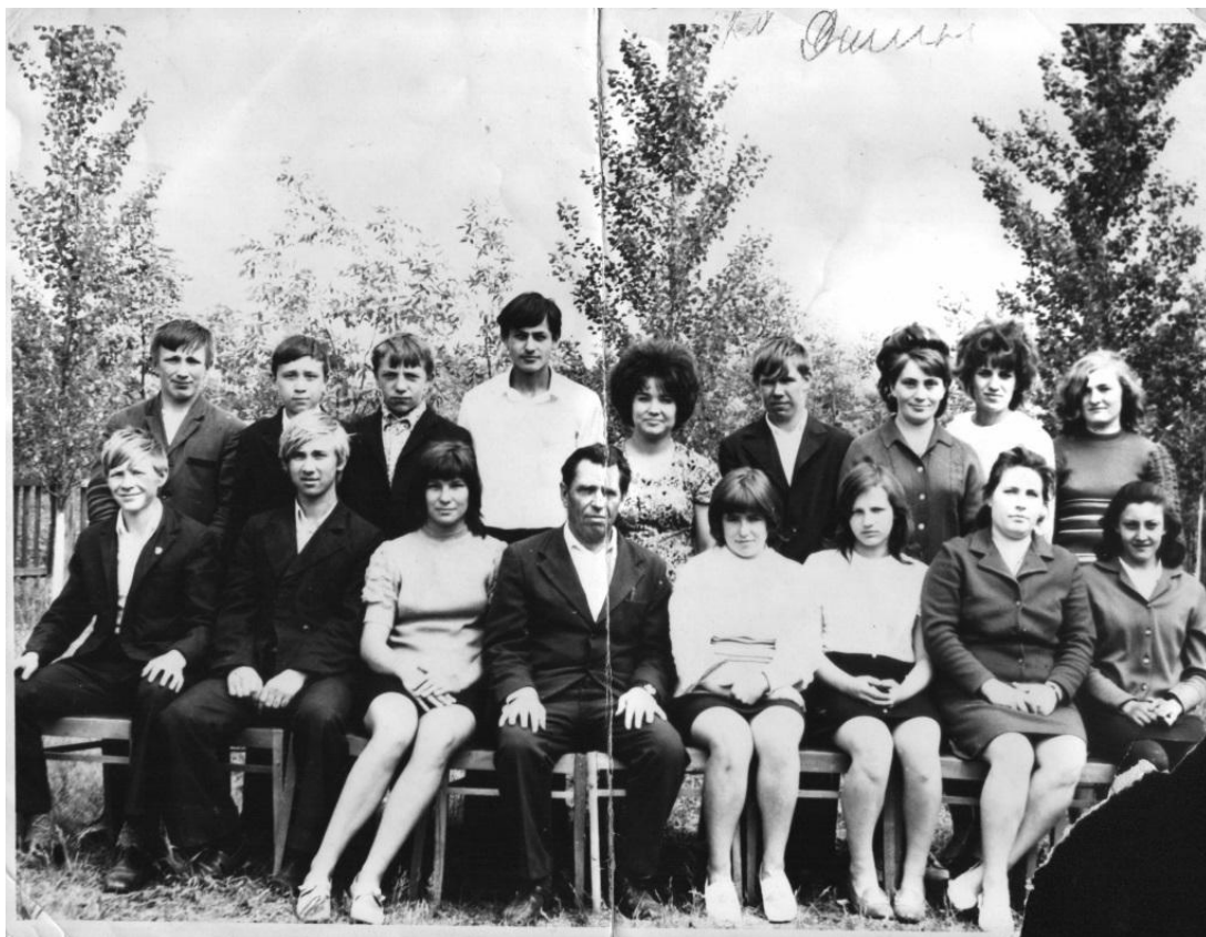
2 класс. Фото 1971 год

Выпуск 1975 года. Ученики этого класса были первыми первоклассниками