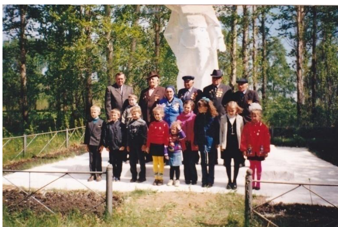
Фото 2003 год

Встреча с ветеранами Великой Отечественной войны. Фото 1999 год